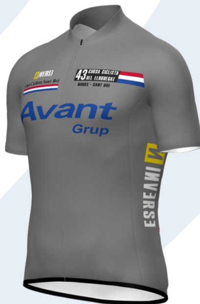
Vencedor METAS VOLANTES