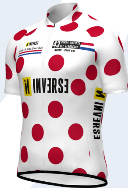
Vencedor PREMIO MONTAÑA