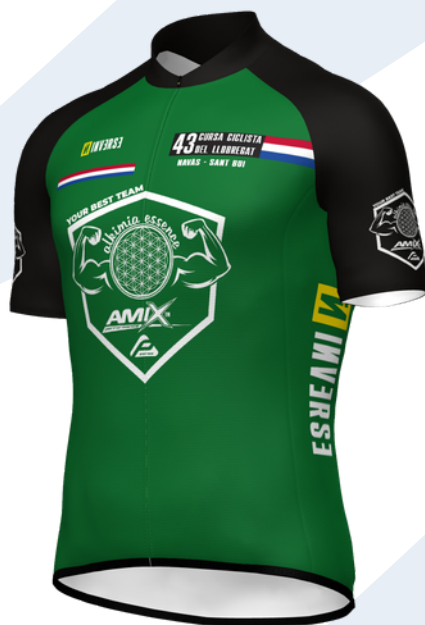
Premio a la COMBATIVIDAD