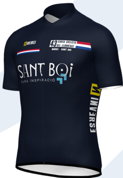
Vencedor GRAN PREMI Ajuntament de Sant Boi