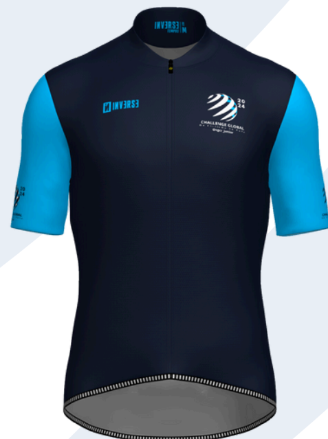
Líder CGOR CHALLENGE GLOBAL DE CICLISMO EN RUTA 2024