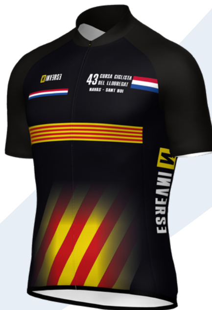
1er corredor AUTONÓMICO